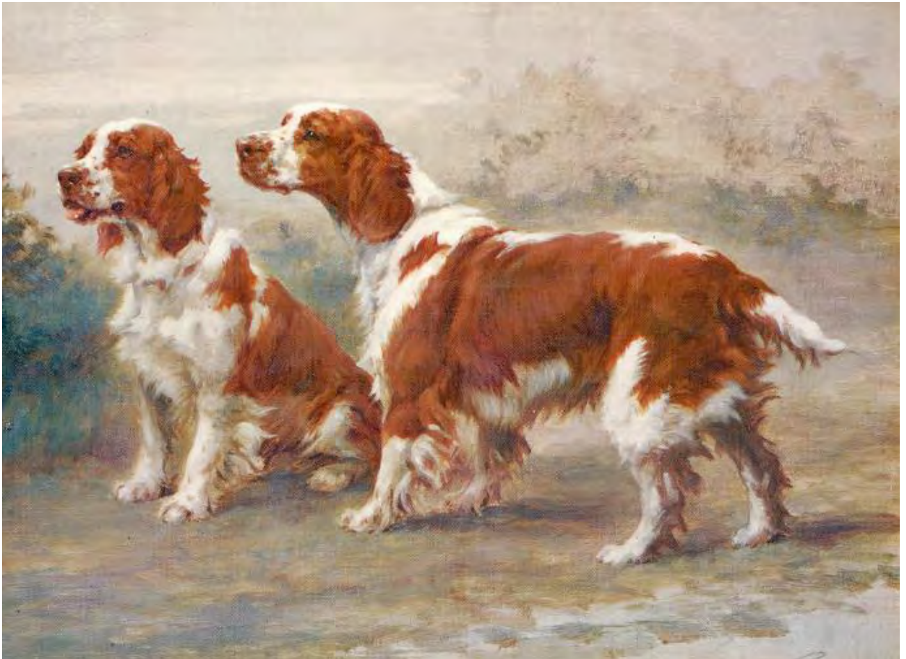
Tavla målad av Maude Earl 1906 föreställande Ch Longmynd Fach och Ch Longmynd Megan. Tavlan tillhör The Kennel Club och anses vara den främsta bilden av rasen genom tiderna.

Denna gamla engelska versstrof är givetvis en sanning med modifikation. Welshen är dock, liksom övriga spaniels, en oerhört mångsidig ras. Anledningen hittar man givetvis i rasens ursprungliga användningssätt. Medan många av de övriga spanielraserna i huvudsak var den engelska aristokratins hundar, så utvecklades den spanieltyp som idag är welsh springern i det då mycket fattiga Wales.