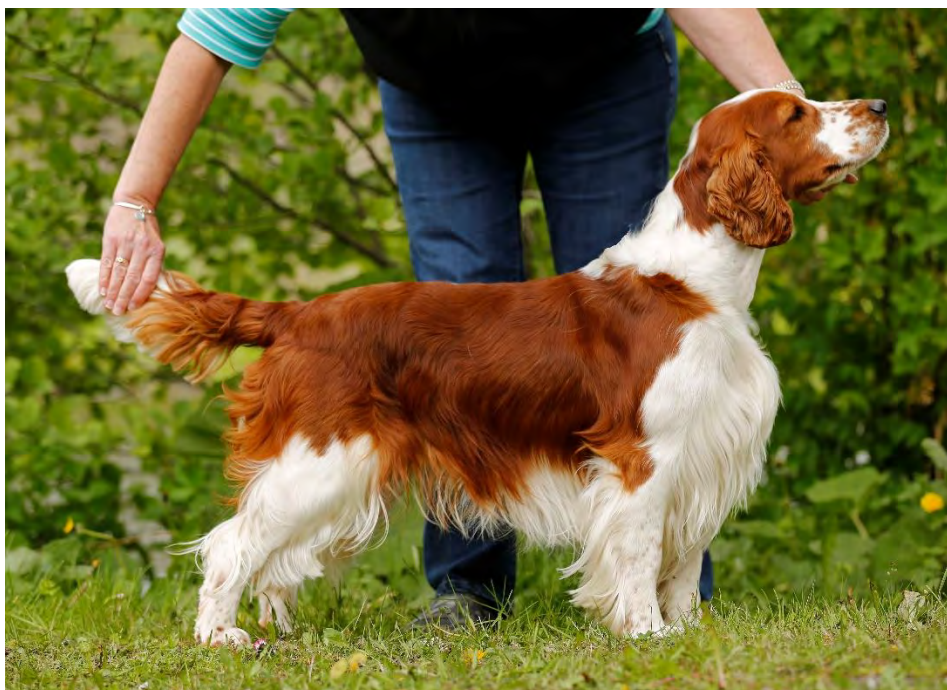
Hanhund ovan, tik nedan

Det är viktigt för ett korrekt helhetsintryck att hunden är stram och muskulös och således behåller sin fysiologiska överlinje även i rörelse. Tänk på helhetsintryckets: "byggd för uthållighet och hårt arbete".